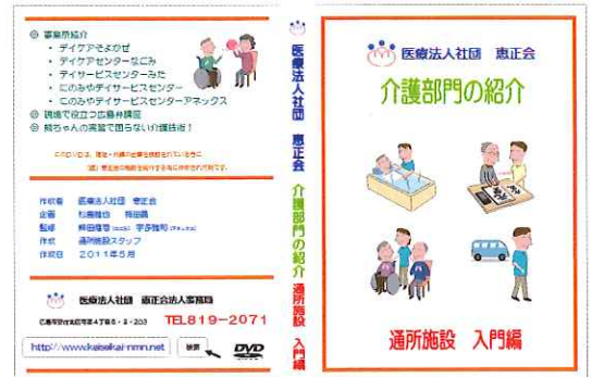
画像は、恵正会より配布の DVD 「介護部門の紹介」通所施設 入門編 左上の画像は、現場で役立つ広島弁講座より

の中で「方言が理解できない」という問題があることを受け、「広島弁講座」のDVDを制作。介護現場のスタッフが日頃から耳にしている広島弁を使った劇にして面白可笑しく解説しました。 現場スタッフによる、リアルな情報発信が学生たちの心に届き、現場スタッフの『産学連携』への想いが形になり、「想いを形に出来る」という介護現場の魅力を創ることが出来たと感じました。 このように様々な方に「魅力ある場」と思っていただけのための取り組みと発信が、今、介護現場に求められているのではないのでしょうか。