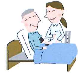
症状の観察や判断

* 病気や障害があっても、 長年住み慣れた地域やわが家で 自分らしく暮らしたい…… そんな願いを実現できるよう お手伝いします。