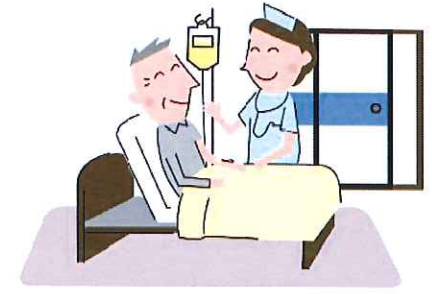
医師の指示に基づく 医療的処置