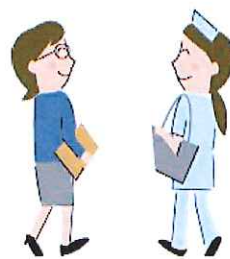
諸機関との調整や連絡