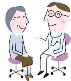
在宅介護のアドバイス