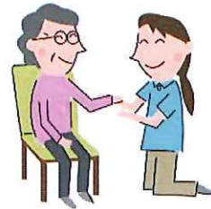
リハビリテーション

* 病気や障害があっても、 長年住み慣れた地域やわが家で 自分らしく暮らしたい…… そんな願いを実現できるよう お手伝いします。