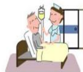
医師の指示に基づく 医療的処置