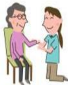
リハビリテーション

病気や障害があっても、 長年住み慣れた地域や我が家で 自分らしく暮らしたい…… そんな願いを実現できるよう お手伝いします。