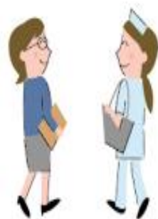
諸機関との調整や連絡