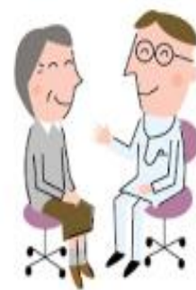
在宅介護のアドバイス