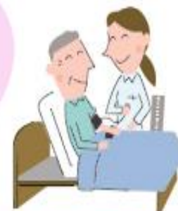
症状の観察や判断

病気や障害があっても、 長年住み慣れた地域や我が家で 自分らしく暮らしたい…… そんな願いを実現できるよう お手伝いします。